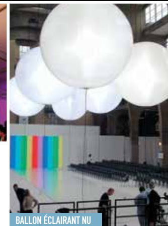
BALLON ÉCLAIRANT NU