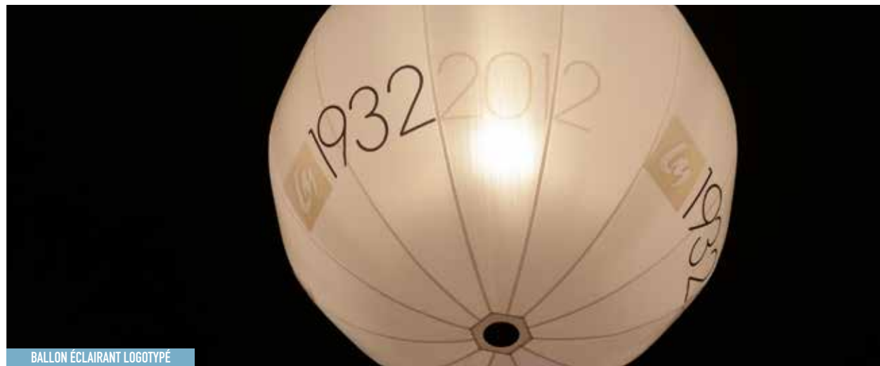
BALLON ÉCLAIRANT LOGOTYPE

(**) Nous consulter : sur demande de devis selon les contraintes techniques et surcoûts éventuels