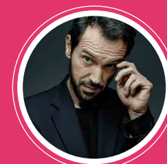
GÉRALD DE PALMAS