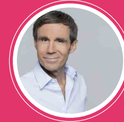
DAVID PUJADAS Présentateur JT