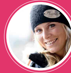
TESSA WORLEY Skieuse